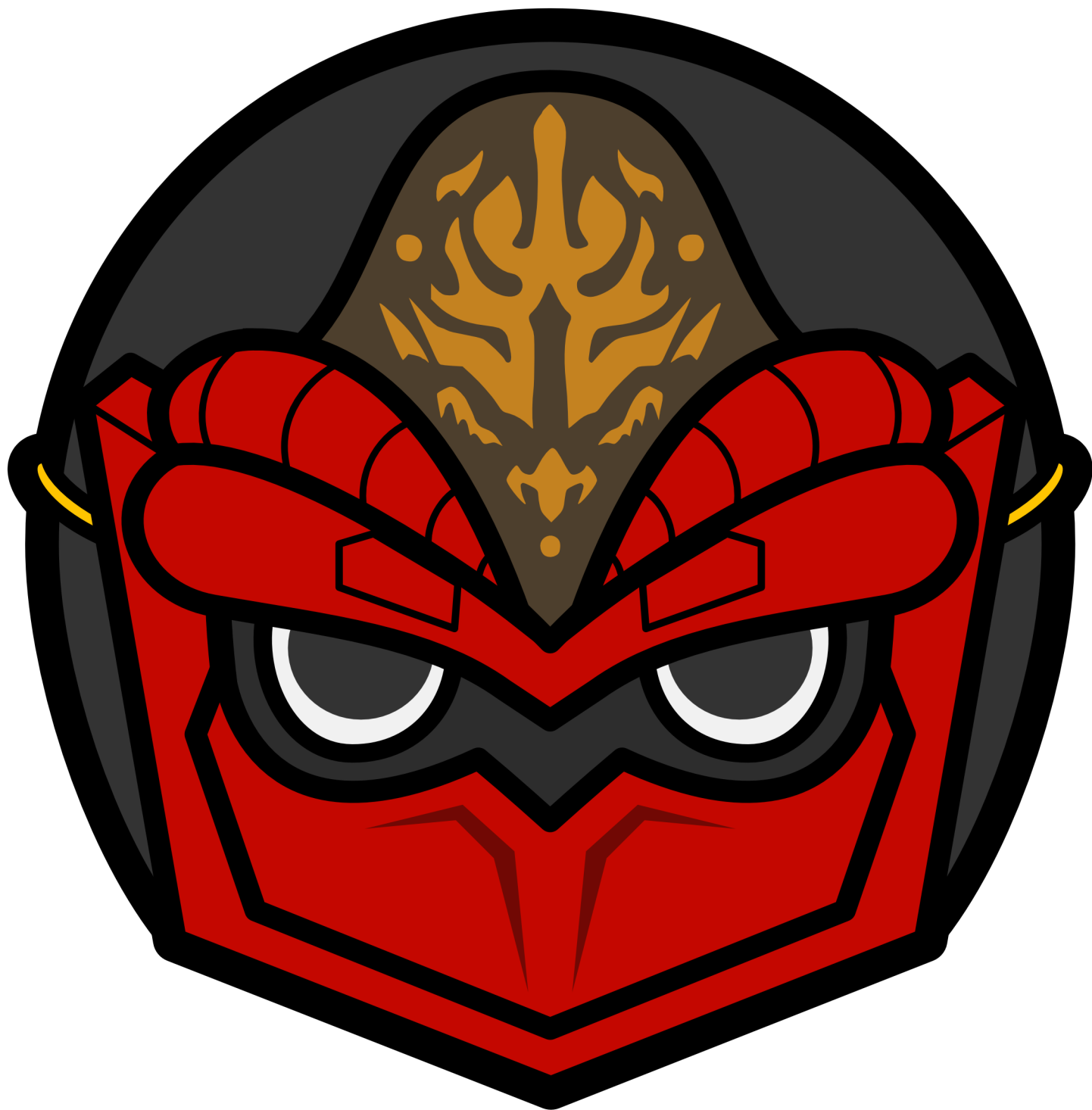
Illustration by mana [ https://8bitfile.jimdofree.com/ ]